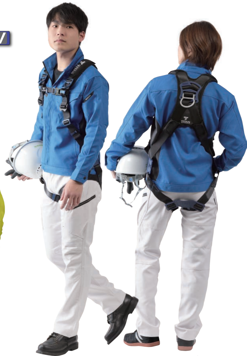
PACN-10A-BL型 ベルトカラー：ブラック