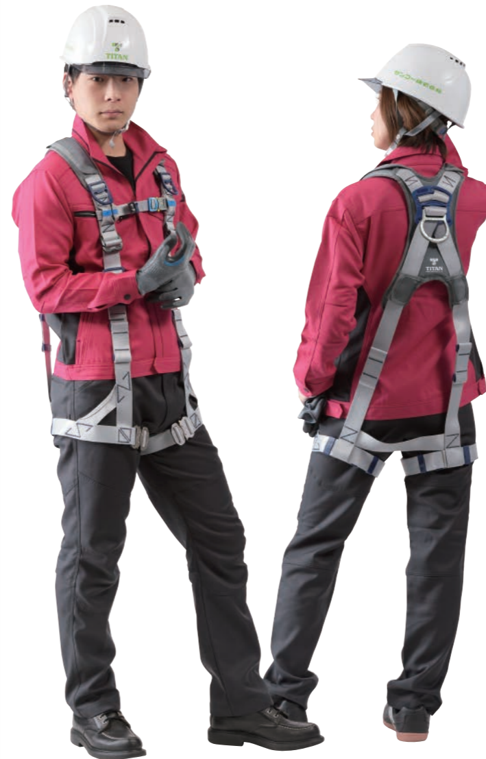
PAHN-10A-SI型 ベルトカラー：シルバー