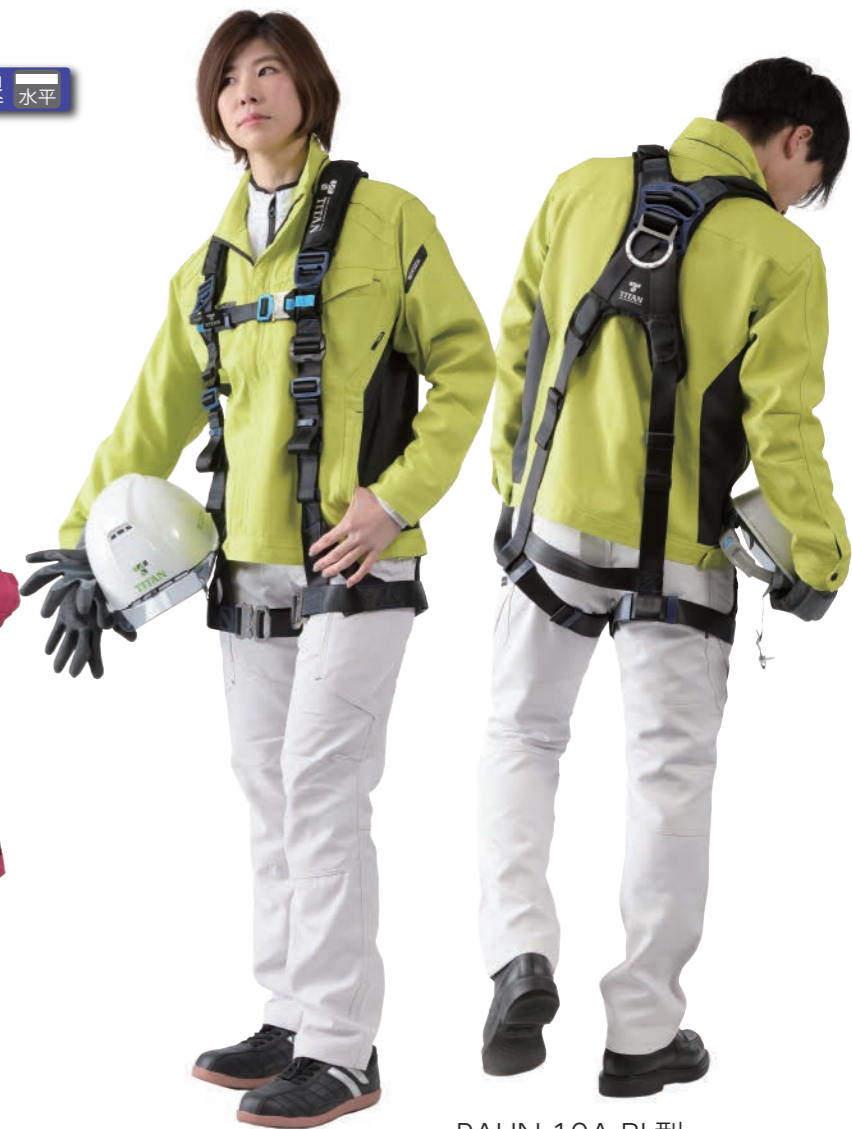
PAHN-10A-BL型 ベルトカラー：ブラック