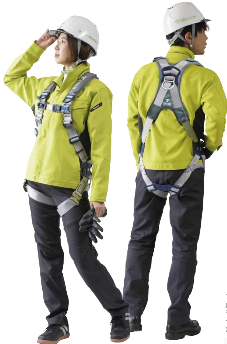
PACN-10A-SI型 ベルトカラー：シルバー